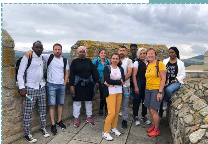
Le groupe lors de la sortie à Montpeyroux

Une visite du village de Montpeyroux, entièrement organisée par les salariés, a eu lieu à la fin de la formation, avec trajet en train et repas partagé le midi.