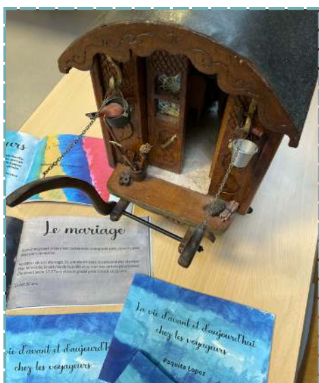
Présentation du recueil Maison des Solidarités des Martres-de-Veyre

Le recueil a été mis en page par Anaïs Sève et imprimé par CLÉS.